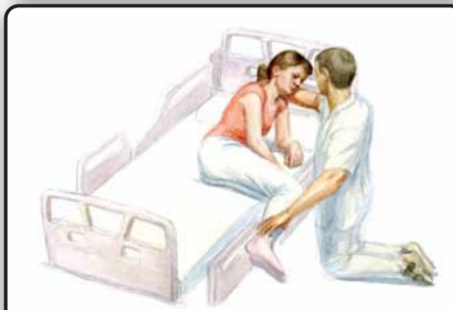
8-2. Присаживание пациента на кровати через здоровую сторону