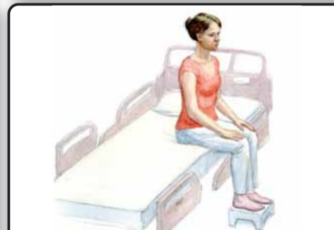
9. Положение пациента сидя на кровати со спущенными ногами