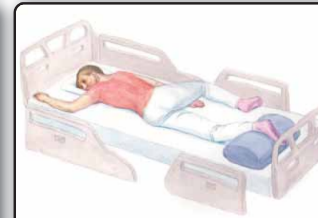
6-4. Положение пациента лежа на животе с контралатеральным сгибанием конечностей