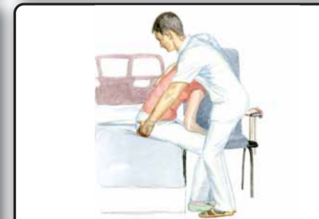
10-1. Перемещение пациента на кресло через здоровую сторону