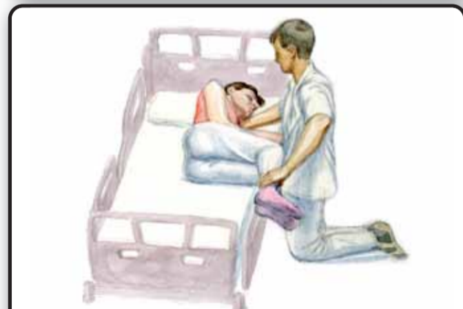
8-1. Присаживание пациента на кровати через здоровую сторону