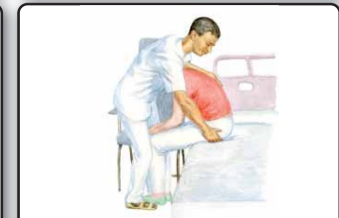
10-2. Перемещение пациента на кресло через паретичную сторону