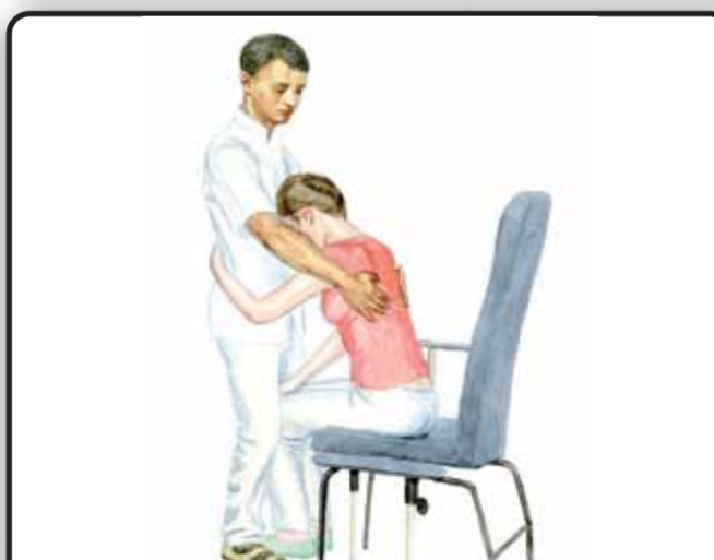
12-1. Вставание пациента из положения сидя