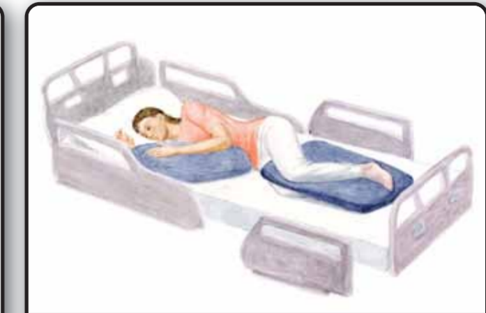
5-1. Положение пациента лежа на здоровом боку