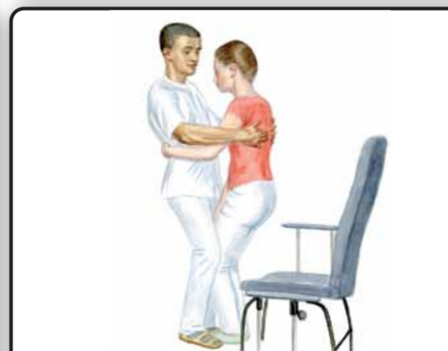
12-2. Вставание пациента из положения сидя