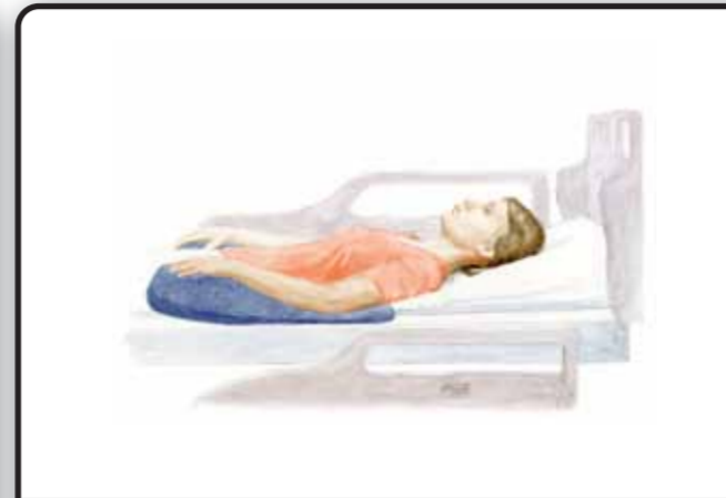
3. Положение головы при положении пациента лежа на спине