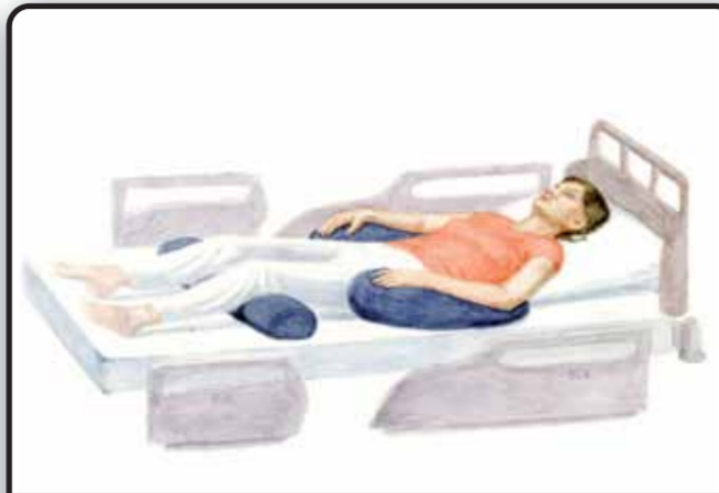
2. Положение пациента лежа на спине