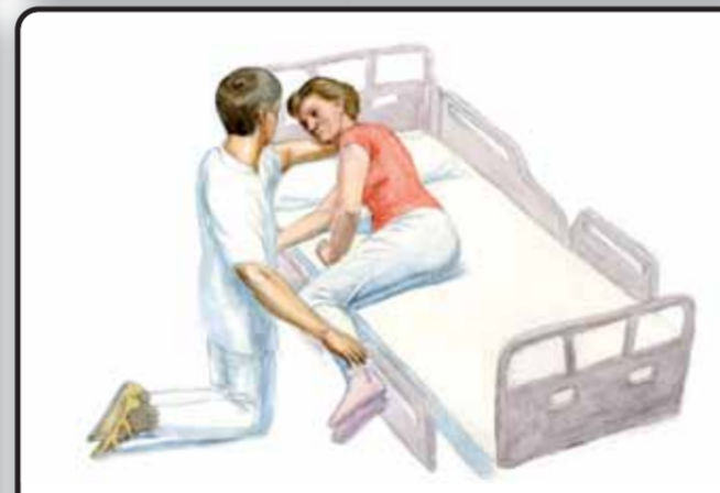
8-3. Присаживание пациента на кровати через паретичную сторону