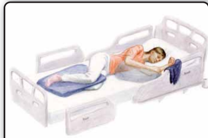
5-2. Положение пациента лежа на паретичном боку