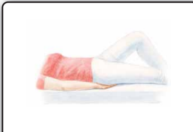
6-1. Положение руки пациента при повороте на живот