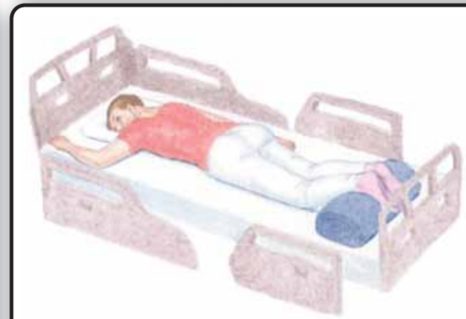
6-2. Положение пациента лежа на животе