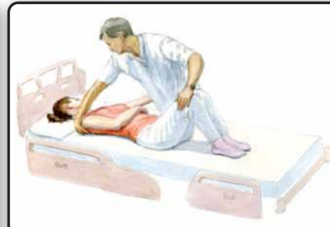
4-1. Поворот пациента на бок