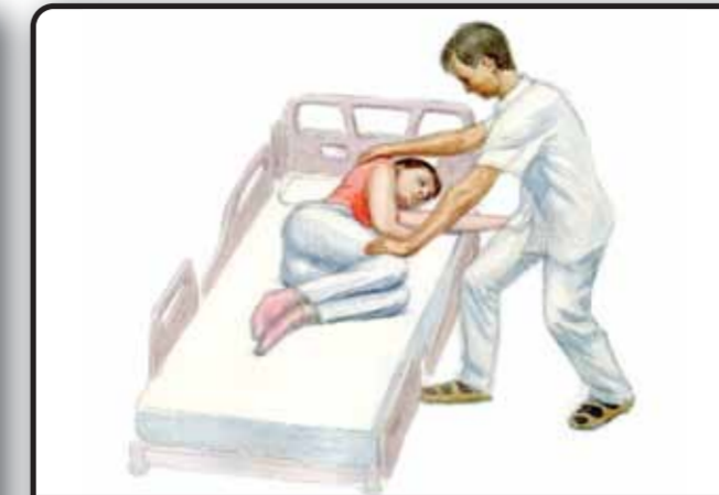
4-2. Поворот пациента на бок