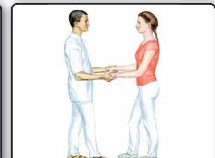
13-3. Шаг и ходьба пациента