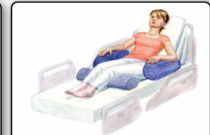
7. Пациент в положении Фаулера