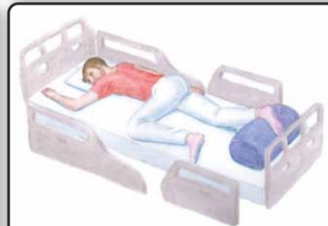
6-3. Положение пациента лежа на животе с гомолатеральным сгибанием конечностей