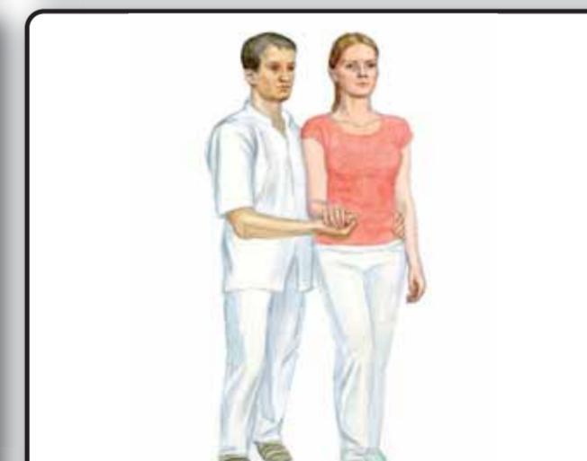
13-2. Шаг и ходьба пациента