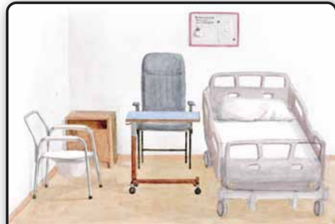
1. Рабочее пространство вокруг пациента